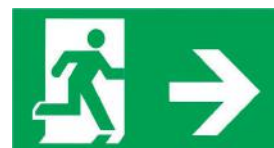
Flèche à droite