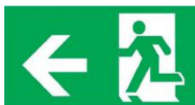
Flèche à gauche